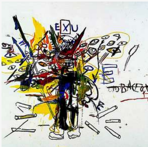
© EXU - Jean Mchel Basquiat

L'art brut et l'art naïf : définis comme des formes d'art exemptes de toute formation ou de culture artistique institutionnelle , et souvent créés par des personnes en marge de la société, j'admire la force que peut prendre leur travail, devenu purement instinctif. Où la pratique, sans connaissance artistique préalable, est capable de créer des formes de langages radicalement différentes et originales. Au sein du Projet Carotte l'envie est d'apprendre de ces formes de création.