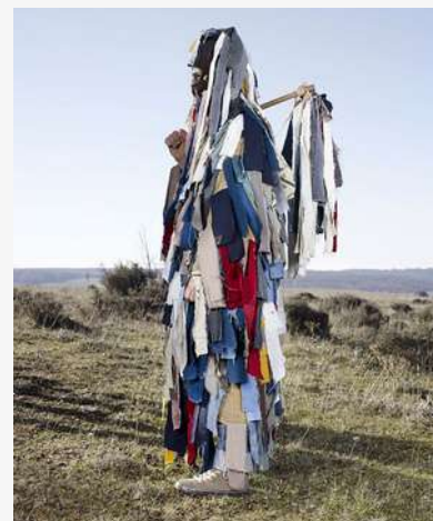
© Wilder Mann - Charles Fréger

Elles sont un magnifique moyen de désamorçage , de retour à la réalité de tous les jours, qui contraste avec l'univers potentiellement étrange et mystérieux du projet.