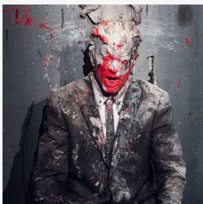
© Transfiguration - Olivier de Sagazan

Le milieu de la débrouille : bricoler avec ce qu'il y a sous la main, faire de la récup, utiliser des "ordures" pour créer. Faire avec ce que le lieu nous propose. L'utiliser tel qu'il est, dans son état primitif, et modeler de manière directe les matières qu'il propose.